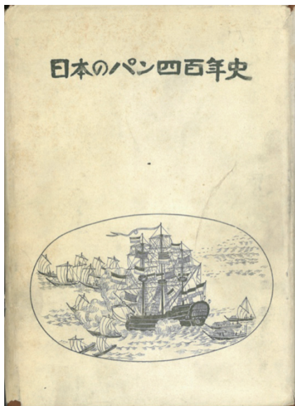
資料1 日本のパン四百年史

私たちが現在、そして未来をより有意義に生きていくためには、過去の歴史を学び、先人の経験から教訓を得ることが大切であるとされています。この歴史の重要性については製パン技術も例外ではありません。しかし、日本のパンの起源、そして古い歴史は不明瞭であるのが実情であると思われます。このような中で、1956年に当時のパン業界の有志の方々が編集して発行された「日本のパン四百年史」(日本のパン四百年史刊行会)が日本のパンの歴史を考える貴重な資料になります。